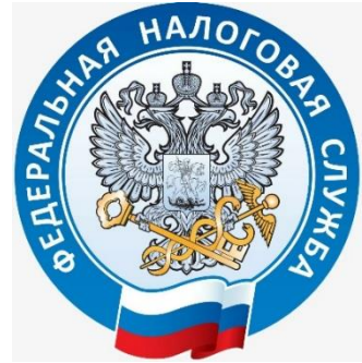
УФНС России по Пермскому краю